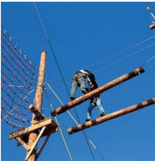
Hochseilgarten in Hitzacker