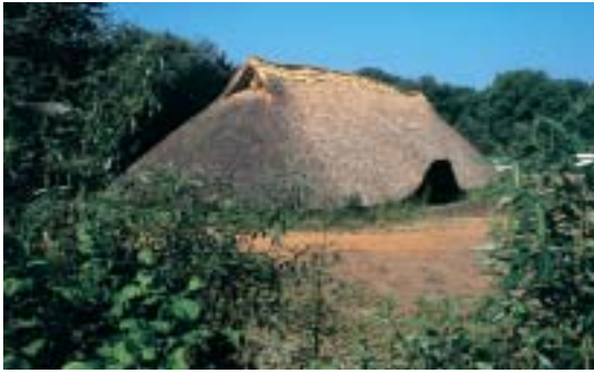
Archäologisches Zentrum Hitzacker