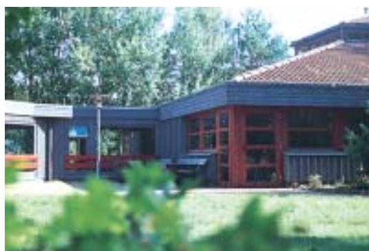
Freizeitanlage in Meudelfitz