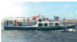
Barkasse „MS Hecht“

● Mit der „ MS Hecht “, der „ MS Wels “ und der „ MS Hilde “ können Sie eine Tour auf Elbe und Elde nach Ihren Wünschen gestalten. Variable Fahrtrouten und -zeiten sowie ein eigener Reiseleiter machen Ihre Bootsfahrt zu einem einmaligen Erlebnis. Die „ MS Hecht “ kann bis zu 22, die „ MS Wels “ bis zu 75 und die „ MS Hilde “ 150 Personen inkl. Fahrrädern aufnehmen. Von Oktober bis März: Elbrundfahrten ins Jagdrevier des Seeadlers ab Hafen Dornitz. Informationen und Buchung unter: Andreas Heckert, Am Wolkfeld 15, 29476 Gusborn, Tel. 05865/10 55 o. 0160/4 40 28 18